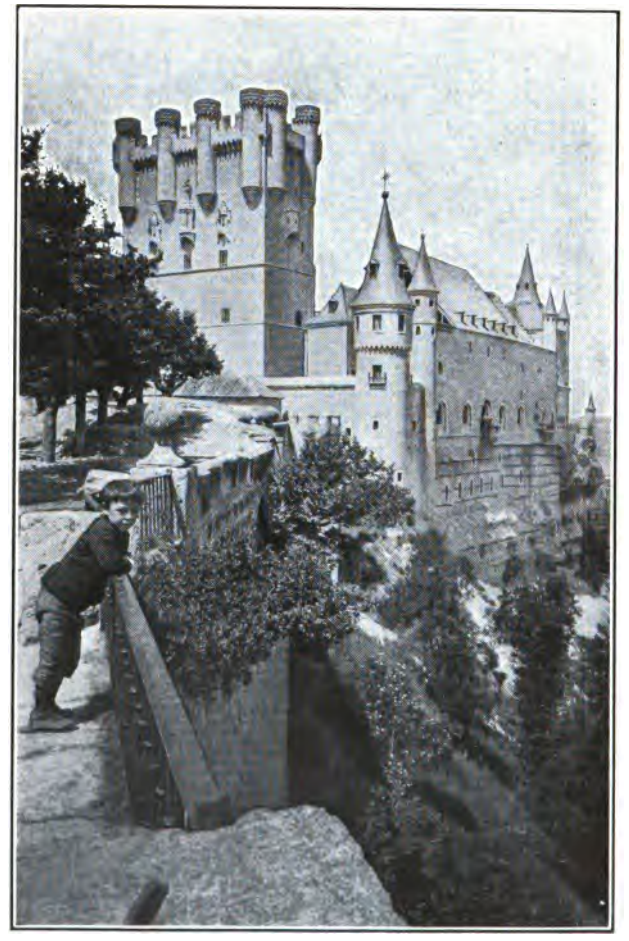
EL ALCÁZAR DE SEGOVIA